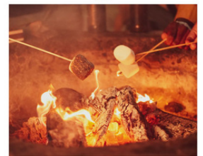
ママンココン運営委員会 焚き火で焼きマシュマロ