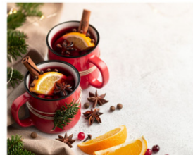
ママンココン運営委員会 ノンアルコールドリンク