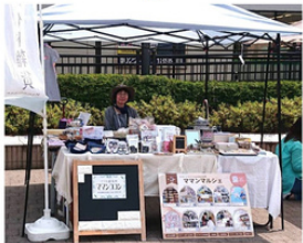
ママンココンのセレクトショップ ハンドメイド雑貨やアクセサリーetc.