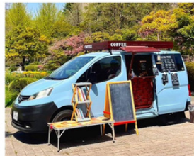
神原珈琲 子育て応援カフェ（デカフェあり）