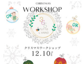
CHRISTMAS WORKSHOP 12.10 tutto_lanno365 幼児から楽しめるの飾れるオーナメント作り