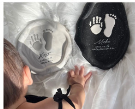
honu jesmonite “石のような落ち着いた風合い” ジェスモナイトを使ったインテリア雑貨販売