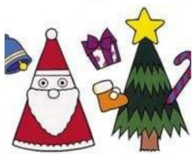
太白区育児サークル応援隊たい子さん* パネルシアター「10人のサンタ」