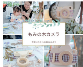
おひるねアートhito-no-wa もみの木カメラを作ろう