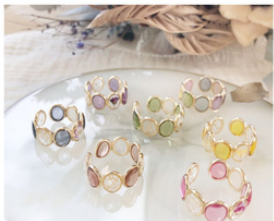
suzu* 本物のお花を使ったレジアンアクセサリー販売